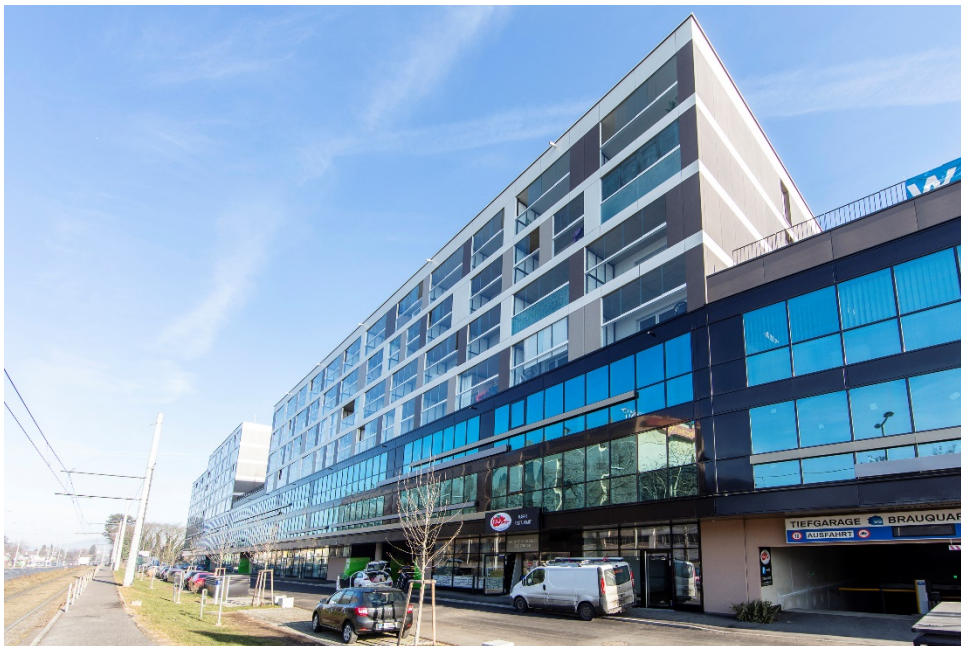
Brauquartier Puntigam | Bauabschnitt 6

Die Emittentin übt die alleinige Geschäftsführung und Vertretung der Bauabschnitt 6 Projekt Zentrum-Puntigam GmbH & Co KG aus. Dies beinhaltet auch die Vertretungskompetenz für die Errichtung des Bauabschnitts 6 des Brauquartiers Puntigam sowie u.a. die Koordination von Bauleistungen, Erbringung von Planungsleistungen, Projektentwicklung und Vertriebstätigkeiten.