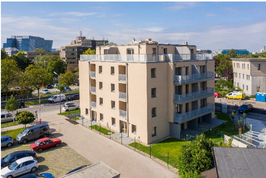
Axel-Corti-Gasse 2, 1030 Wien