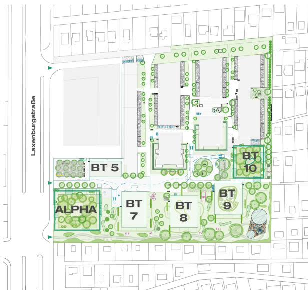
Übersichtsplan | Laxenburgerstraße 151, 1100 Wien

Die Emittentin übt die alleinige Geschäftsführung und Vertretung der IR Laxenburgerstraße GmbH & Co KG aus. Dies beinhaltet auch die Vertretungskompetenz für die Errichtung des Projekts Laxenburgerstraße 151, 1100 Wien sowie u.a. die Koordination von Bauleistungen, Erbringung von Planungsleistungen, Projektentwicklung und Vertriebstätigkeiten.