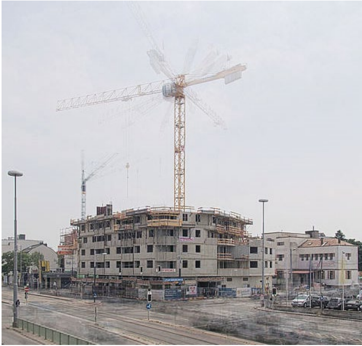
Baustellenfoto 20.06.2021 | Genochplatz 1, 1220 Wien

Die Emittentin übt die alleinige Geschäftsführung und Vertretung der C&P Projekt Genochplatz GmbH & Co KG aus. Dies beinhaltet auch die Vertretungskompetenz für die Errichtung des Projekts Genochplatz sowie u.a. die Koordination von Bauleistungen, Erbringung von Planungsleistungen, Projektentwicklung und Vertriebstätigkeiten.