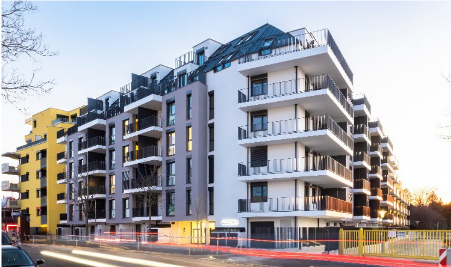
Heinrich-von-Buol-Gasse 1, 1030 Wien