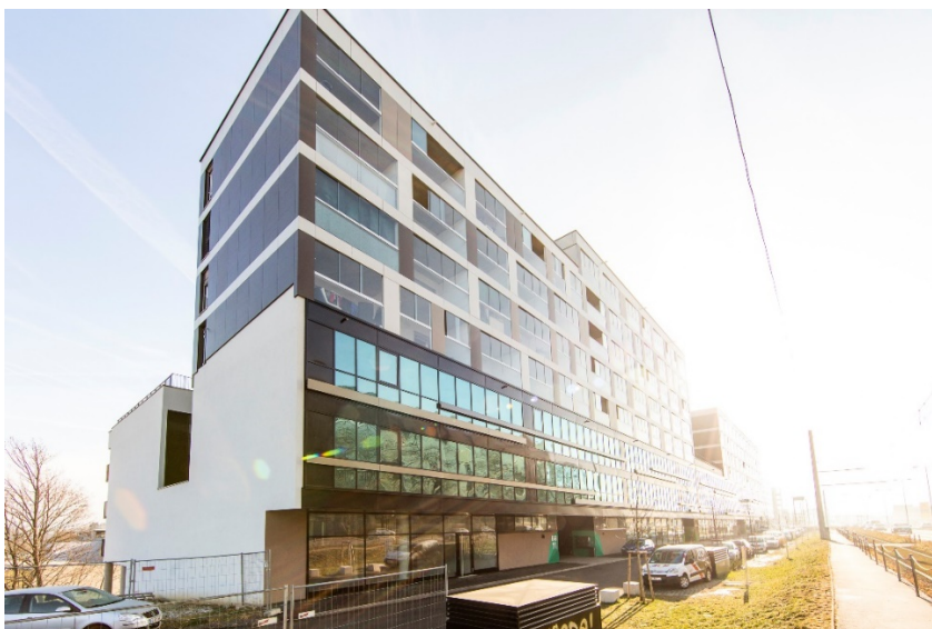
Brauquartier Puntigam | Bauabschnitt 8