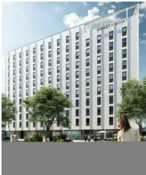
Im Entwicklungsgebiet Muthgasse in Heiligenstadt entstehen 313 Einheiten Serviced Apartments unter der Marke Smartments.

Für professionelle Vermieter von Serviced Apartments könnte die Krise zur Chance werden, da ein kontaktloser Umgang hier gut aufrecht zu erhalten ist. Mikrowohnungen mit Service sind im Kommen.