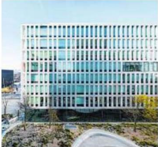
Bürohaus DENK DREI im 2. Bezirk. Entwickler: IC Development. Architekt: Atelier Chaix & Morel et Associés