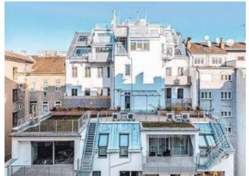
Bel-vedere 1030, Sanierung und Aufstockung. Projektentwickler: Gassner&Partner. Architekt: Atelier Kaindl+ Kuntner