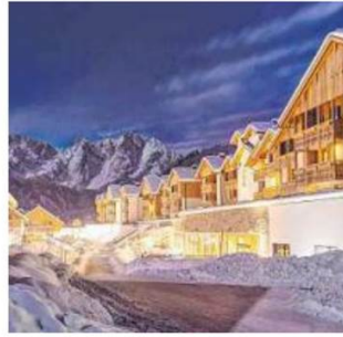
Kinderhotel Dachsteinkönig in Ober-österreich. Entwickler: Mayer Family Hotels. Architekt: Zeytinoglu ZT