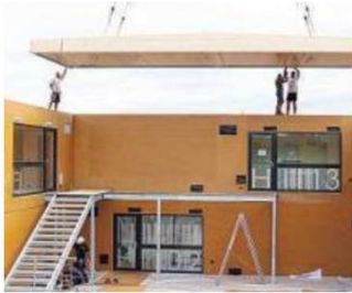
PopUp dorms: temporärer Wohnraum, 22. Bezirk. Entwickler: LANG consulting. Architekt: F2 ZT