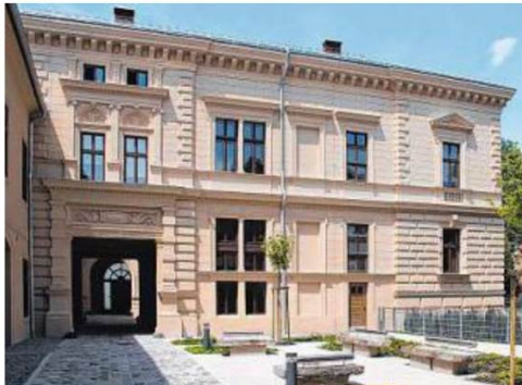
Restaurierung des Palais Löwenfeld & Hofmann. Entwickler: Linz Textil Holding. Architekt: Klinglmüller ZT