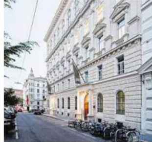
Telegraf 7 in Wien-Mariahilf. Büros in k. u. k. Telefonzentrale. Entwickler: Lehargasse 7. Architekt: BEHF