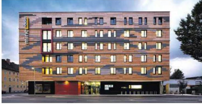
OeAD-Gästehaus mineroom Leoben, Passivhaus-Studentenheim in Holzbauweise. Entwickler: OeAD-Wohnraumverwaltung, Architekt: AP ZT