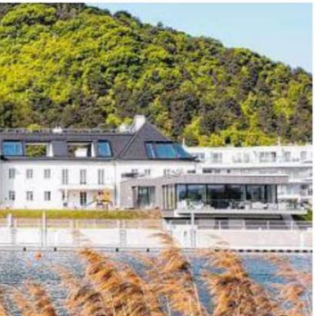
Bezirk wurden in Wohnraum Architekt: the sopht loft