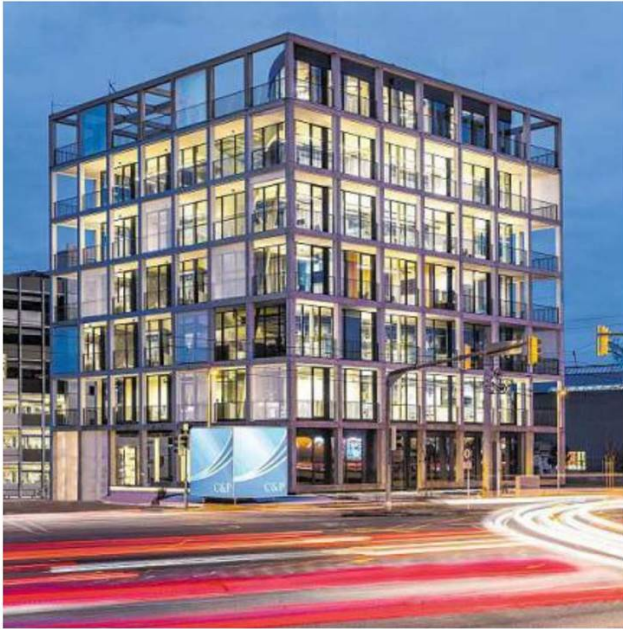
Bürohaus Brauquartier 2 in Graz, Headquarter für C&P Immobilien. Projektentwickler: C&P Immobilien AG. Architekt: INNOCAD architecture