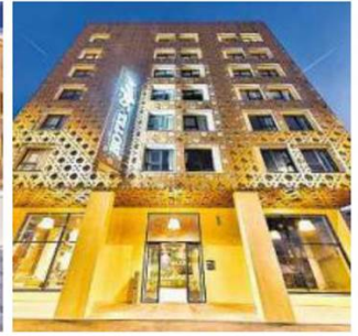
Hotel Schani beim Hauptbahnhof Wien. Entwickler: H5. Architekt: archisphere Gabriel Kacerovsky ZT