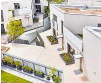
ODO lebt: Eine Fabrik im 16. Bezirk wurde zu Wohnraum. Entwickler: PRISMA. Architekt: querkraft zt