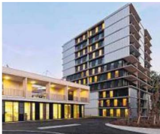
Sozialpastorales Zentrum St. Paulus Innsbruck. Entwickler: Neue Heimat Tirol. Architekt: marte.marte