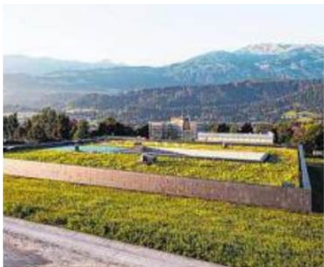
Sammlungs- und Forschungszentrum der Tiroler Landesmuseen in Hall. Entwickler/Architekt: Franz und Sue ZT