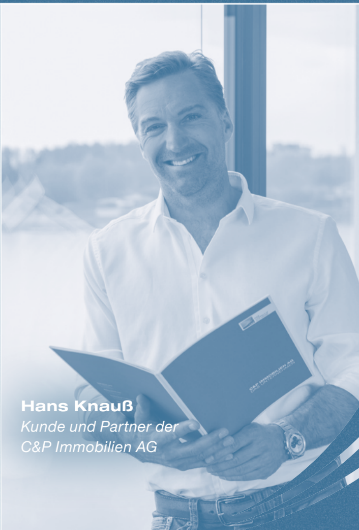
Hans Knauß Kunde und Partner der C&P Immobilien AG