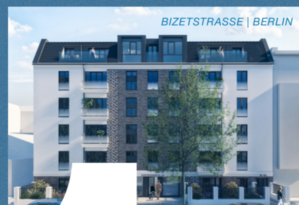
BIZETSTRASSE | BERLIN

Bevor das Neue beginnt, muss das Vergangene gewürdigt werden. Wir verabschieden uns in Dankbarkeit vom Jahr 2021.