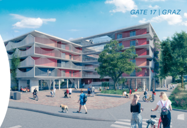
GATE 17 | GRAZ