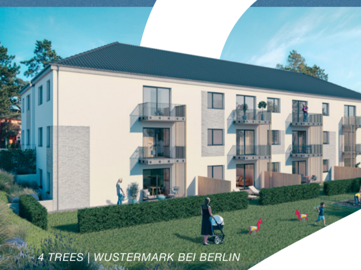
4 TREES | WUSTERMARK BEI BERLIN