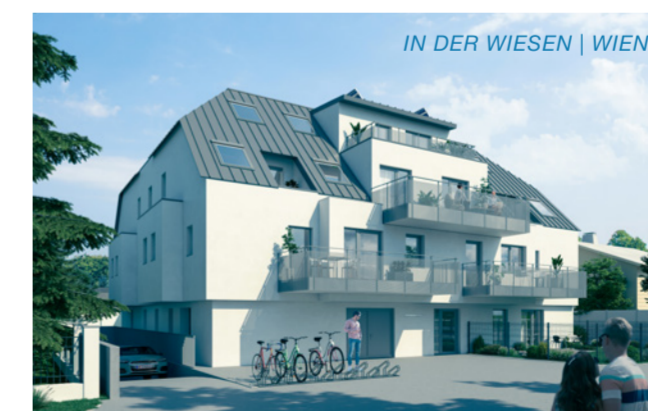
IN DER WIESEN | WIEN