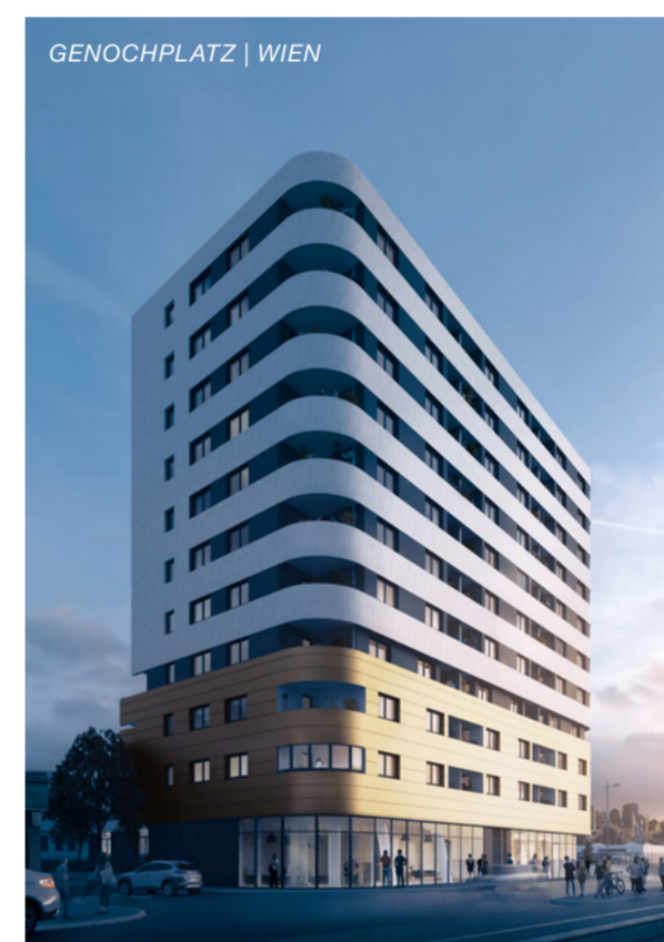
GENOCHPLATZ | WIEN

Ja, es war ein gutes Jahr. Weder politische Einflüsse noch die allgegenwärtige Pandemie haben sich negativ auf die Immobilienbranche ausgewirkt – ganz im Gegenteil, die Nachfrage nach zukunftsfittem Wohnraum sowie renditeträchtigen und vor allem sicheren Vorsorgeprodukten ist ungebrochen. Als Vertriebsvorstand der C&P Immobilien AG möchte ich mich an dieser Stelle für das erwiesene Vertrauen in unsere Produkte bedanken und freue mich auf die kommenden Projekte im nächsten Jahr!