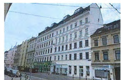
Erdbergstraße 148 & 150, 1030 Wien