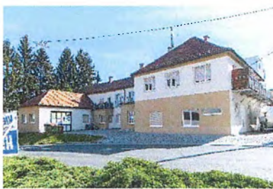
Neuholdaugasse 51, 8010 Graz

***) Das Objekt Erdbergstraße 148 & 150, 1130 Wien wurde mit Kaufvertrag vom 18.10.2018 erworben. 2020 wurden TOP 47+48 und 2021 TOP 31 verkauft. Im Jahr 2022 wurden TOP 38-40, sowie TOP 10/11 verkauft. Im Jahr 2023 wurde der Verkauf der Wohnung TOP 31 rückabgewickelt.