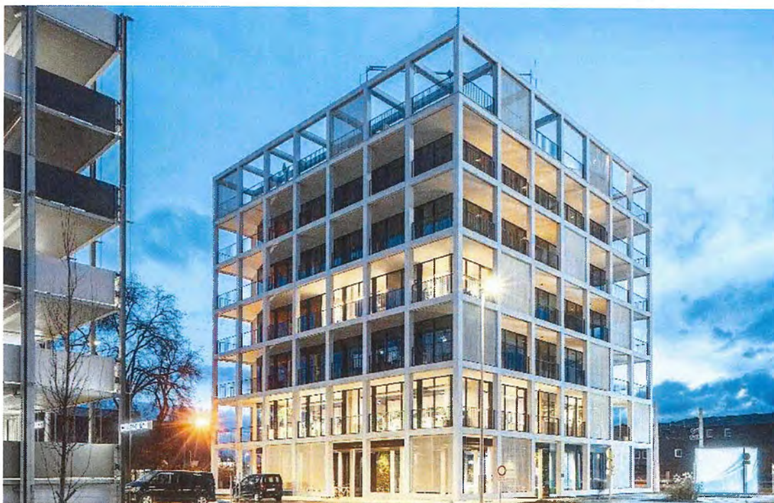
C&P Headquarter Graz