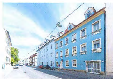
Hackbergasse 30, 8020 Graz