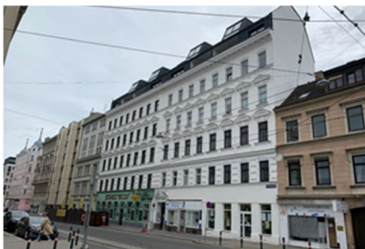
Erdbergstraße 148 & 150, 1030 Wien

* Das Objekt Erdbergstraße 148 & 150, 1130 Wien wurde mit Kaufvertrag vom 18.10.2018 erworben. 2020 wurden TOP 47+48 und 2021 TOP 31 verkauft. Im Jahr 2022 wurden TOP 38-40, sowie TOP 10/11 verkauft. Im Jahr 2023 wurde der Verkauf der Wohnung TOP 31 rückabgewickelt. Im Jahr 2024 wurden Top 35-36 verkauft. Im Geschäftsjahr 2025 wurde für potenziell anfallende Sanierungskosten eine Rückstellung in Höhe von TEUR 200 gebildet und als Anlagen im Bau aktiviert. Diese Position wurde um EUR 21 697,44 auf einen Buchwert von EUR 178 302,56 abgewertet.